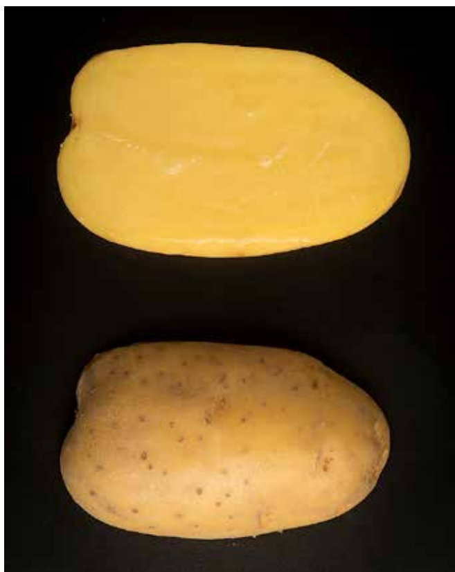
Figure 1 | Ballerina est une variété mi-précoce de type culinaire B–A avec une chair jaune claire. Elle a une bonne tubérisation et un rendement moyen à élevé. Elle est peu sensible aux chocs et se conserve bien. Ballerina est sensible au mildiou et au virus Y, mais a une bonne résistance aux autres maladies.

L'interprofession, swisspatat, regroupe la production, le commerce et l'industrie alimentaire. Le groupe variétés de swisspatat (AGS) est chargé d'étudier les nouvelles variétés de pomme de terre proposées sur le marché européen. Ce groupe établit chaque année une liste des variétés de